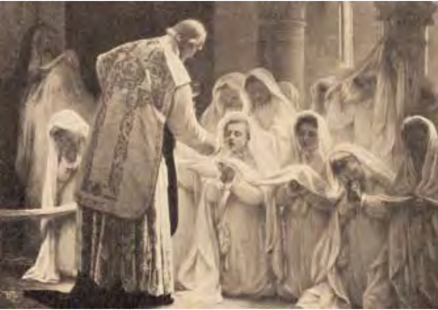
Blancard: La Prima Comunione.

to, poi, condannerà a fondo tutta la sua dottrina.