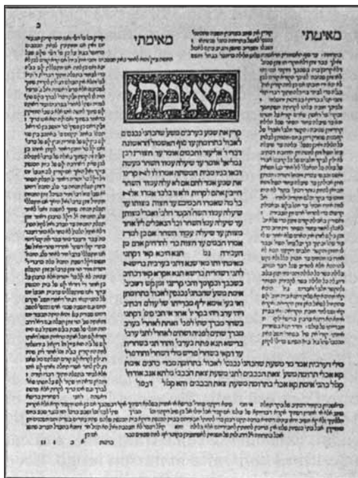
Una pagina del Talmud; in mezzo la Misnà e la Gemarà

(...) Qualsiasi codice scritto [Torà] è necessariamente accompagnato da tradizioni... sul modo di intenderlo ed applicarlo [Misnà o seconda Legge orale], perché la lettera nuda sarebbe in balia dei pregiudizi, del capriccio, delle passioni [come il libero esame luterano], ed invece di servire da vincolo di unità..., diverrebbe un oggetto di discordia. Il popolo si scinderebbe in sette (...). Così oltre la Legge scritta, dettata, dalla prima parola